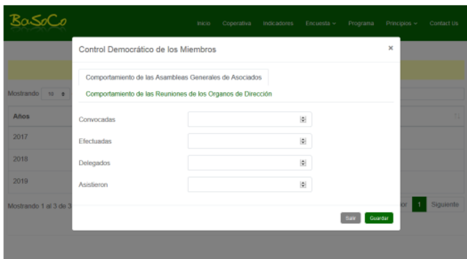
Figura 3. Diferentes rasgos del principio de control democrático de los miembros en el cooperativismo.