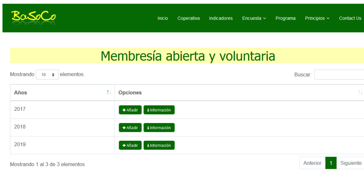
Figura 1. Principio de membresía abierta y voluntaria en el cooperativismo.

Los principios que rigen el cooperativismo, revelan las particularidades en el funcionamiento y administración de las empresas cooperativas, así como sustentan su Responsabilidad Social Directa, definiendo con precisión los ámbitos de actuación para el desempeño de esta.